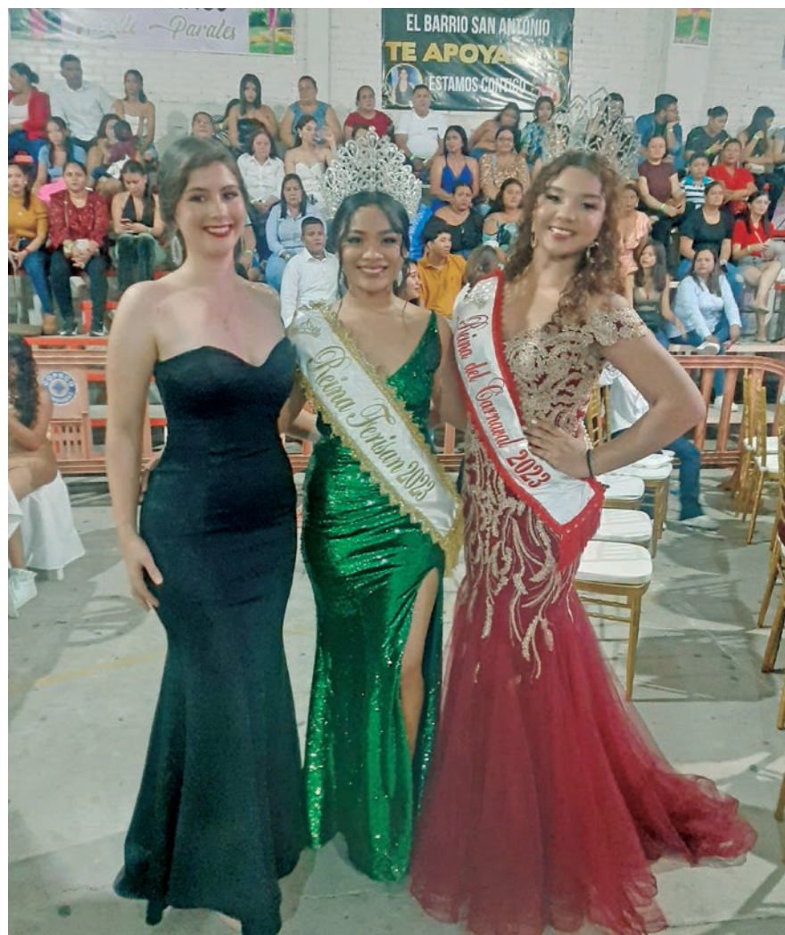
Reinas salientes de FERISAN

Emocionante evento que abre las ferias agostinas de la FERIA DE SAN LORENZO y que se realizan a mediados del mes de agosto.